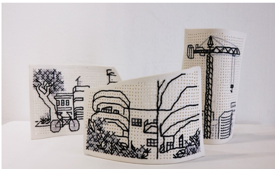
אליה לוי יונגר

עלות: 975 ש"ח ל-5 מפגשים / כולל 5 ק"ג פורצלן, חומרים ושריפות