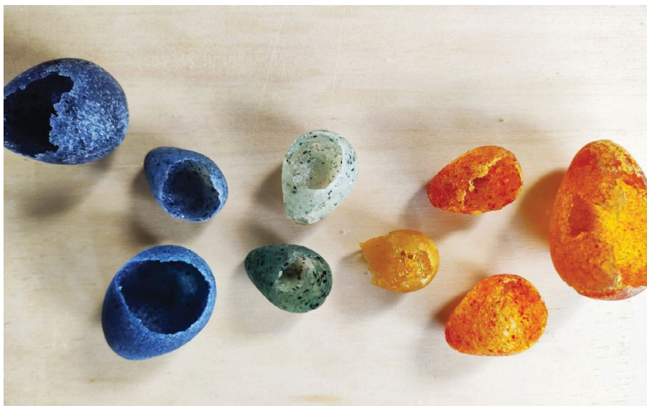
זהר אורן

עלות: 900 ₪ ל-3 מפגשים / כולל זכוכית, חומרים ושריפות