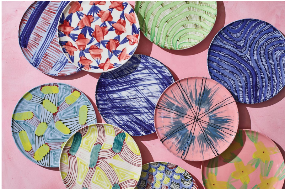
גור ענבר