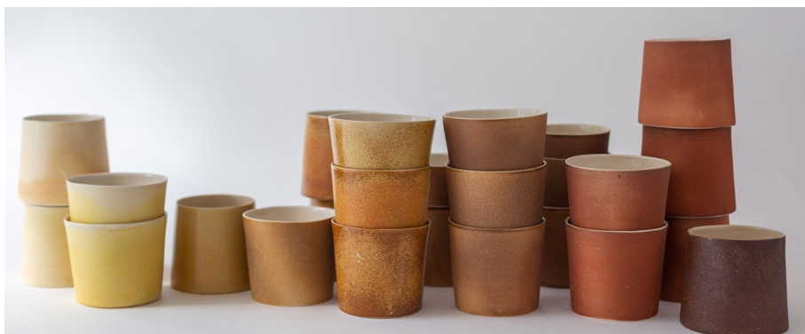
טוראל גירלז

עלות: 1,000 ₪ ל-5 מפגשים / כולל חומרים, שריפות וערכת כלי עבודה