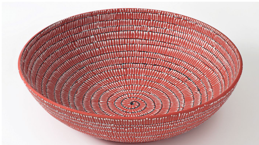
מעין בן יונה

עלות: 975 ₪ ל-5 מפגשים / כולל 5 ק"ג פורצלן, חומרים ושריפות