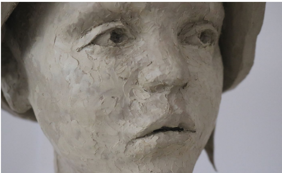
שני שמש | ילדום שני שמש

עלות: 1,020 ₪ ל-5 מפגשים / כולל מודל, חומרים ושריפות