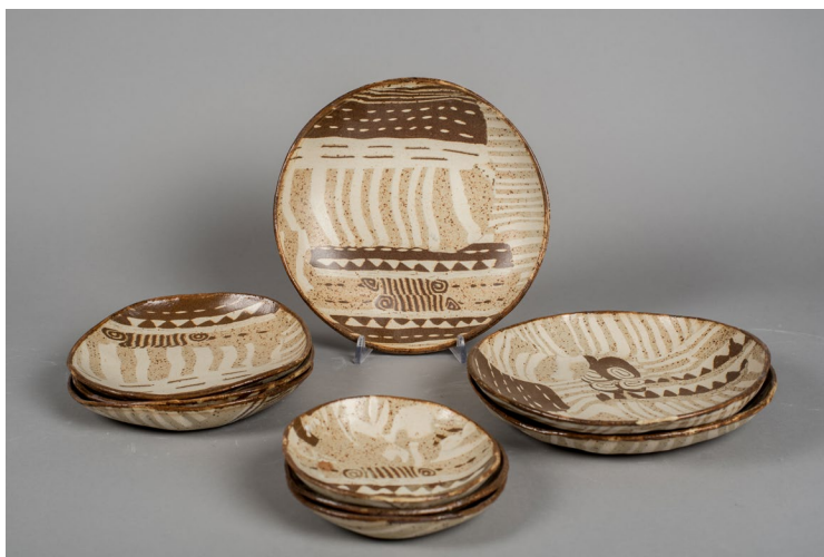
נצה בר | אילום: אילן עמית

מפגש נוסף לזיגוג עבודות בסטודיו פתוח – תאריך יקבע בסדנה Glazing in the open studio – date to be determined