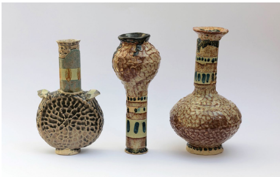
סיון שפנר

עלות: 1,000 ש"ח ל-5 מפגשים / כולל חומרים, שריפות וכלי עבודה בסיסיים