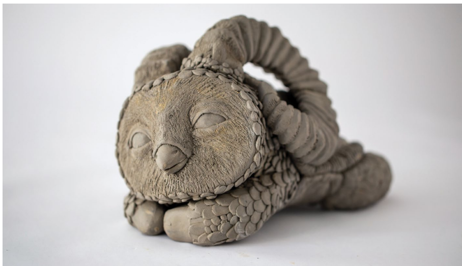
אופיר נאור

מפגש נוסף לזיגוג עבודות בסטודיו פתוח – תאריך יקבע בסדנה Glazing in the open studio – date to be determined