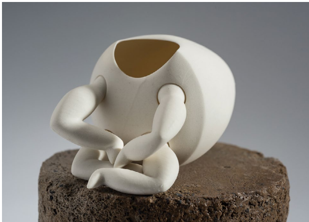
עדנה אוליבר

MONDAY רביעי 22:00-19:00 2.8 / 26.7 / 19.7 / 12.7 / 5.7