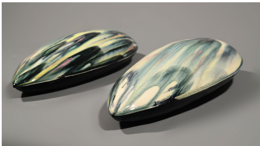
אלינה טופרמן איטן

עלות: 900 ₪ ל-5 מפגשים / כולל חומרים ושריפות