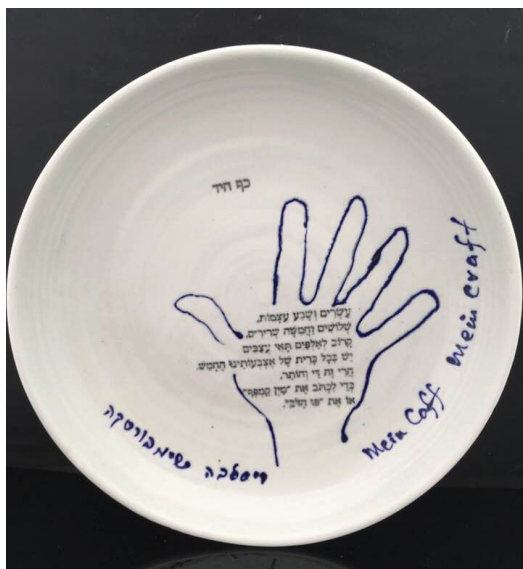
אתי גורן

מפגש נוסף לזיגוג עבודות בסטודיו פתוח – תאריך יקבע בסדנה Glazing in the open studio – date to be determined