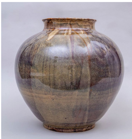
ג'קרנדה קורי

מפגש נוסף לזיגוג עבודות בסטודיו פתוח – תאריך יקבע בסדנה Glazing in the open studio – date to be determined