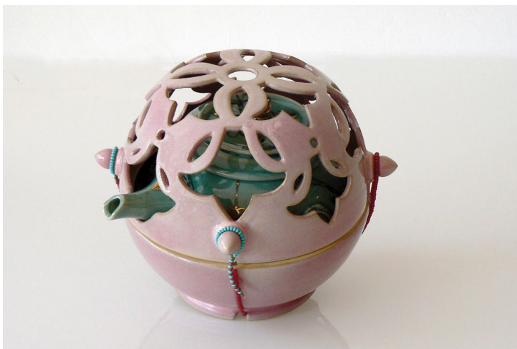
אמנון עמוס

עלות: 900₪ ל-5 מפגשים / כולל חומרים ושריפות