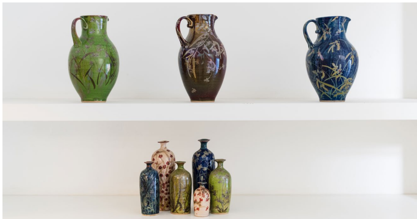
רעיה שטרן

מפגש נוסף לזיגוג עבודות בסטודיו פתוח – תאריך יקבע בסדנה Glazing in the open studio – date to be determined