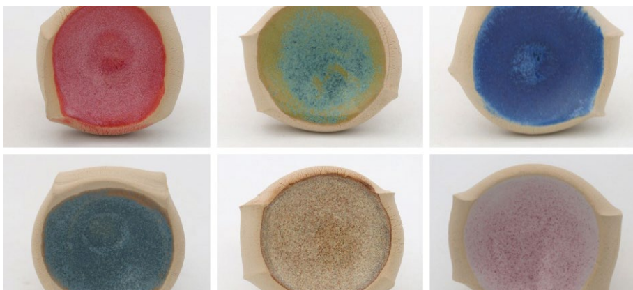
מיכל קורן

עלות: 900₪ ל-5 מפגשים / כולל חומרים ושריפות