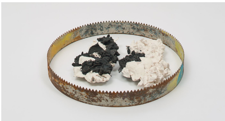
תעות רבוח

עלות: 900 ₪ ל-5 מפגשים / כולל חומרים ושריפות